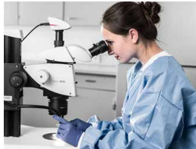
Analyse von Transplantaten unter dem Stereomikroskop

Unsere Transplantate sind frei von Konservierungsstoffen, Antibiotika, tierischen Bestandteilen und sind weder bestrahlt, noch thermisch behandelt.