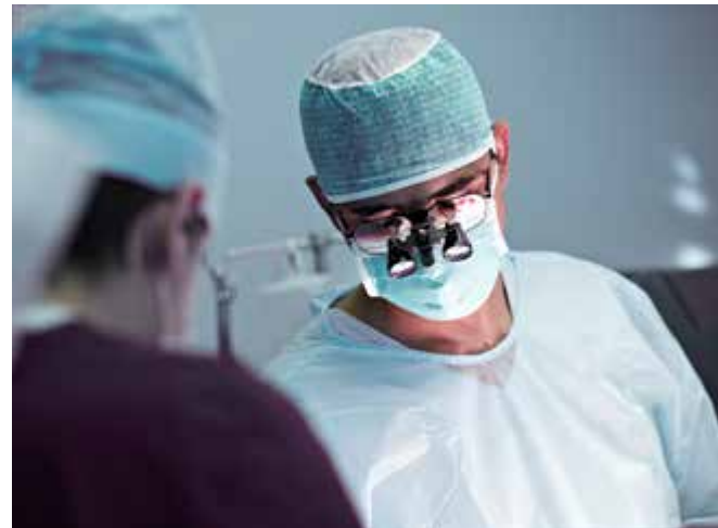
Speziell ausgebildete Mitarbeiter bei der Gewebeentnahme

Bei postmortalen Spenden ist die Gewebeentnahme nur in einem bestimmten Zeitintervall nach Feststellung des Todes erlaubt. Für die muskuloskelettalen Spenden, welche das DIZG verarbeitet, beträgt das Intervall bis zu 48 Stunden .